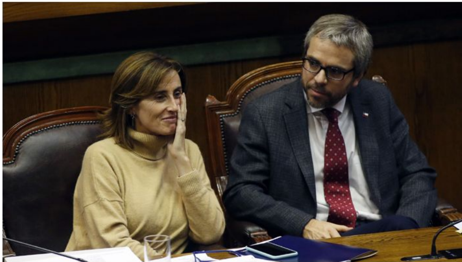
La ministra junto a su par de la Segpres, Gonzalo Blumel, en la votación del proyecto.