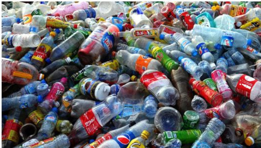
El Mercurio (imagen referencial)