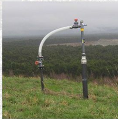
CAPTURA DE GAS DE RELLENOS SANITARIOS