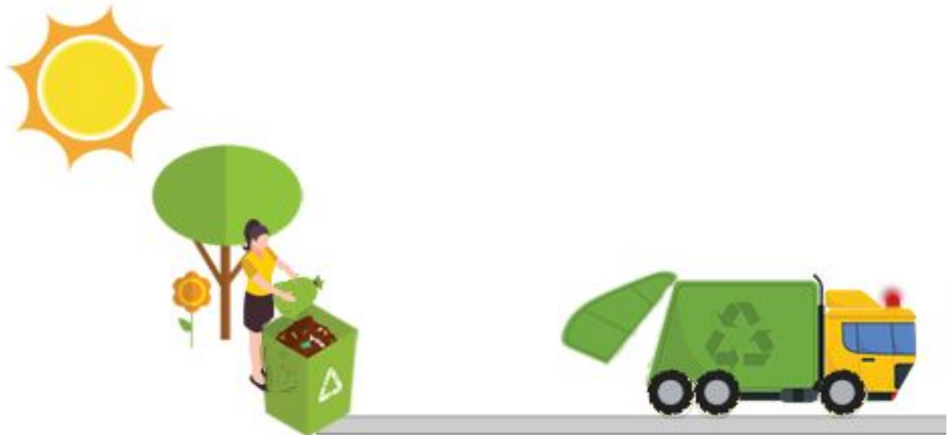
Residuos Orgánicos Separados en la Fuente